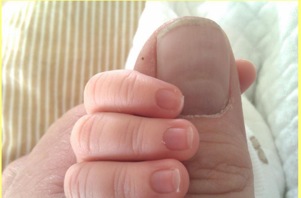
Foto: Forfatterens nyfødte barnebarn marts 2011, der holder om sin farfars finger

reaktioner i forbindelse med graviditet, fødsel, efterfødselsreaktioner og depressioner. Har 30 års erfaring i forebyggelse og behandling på området og arbejder landsdækkende.